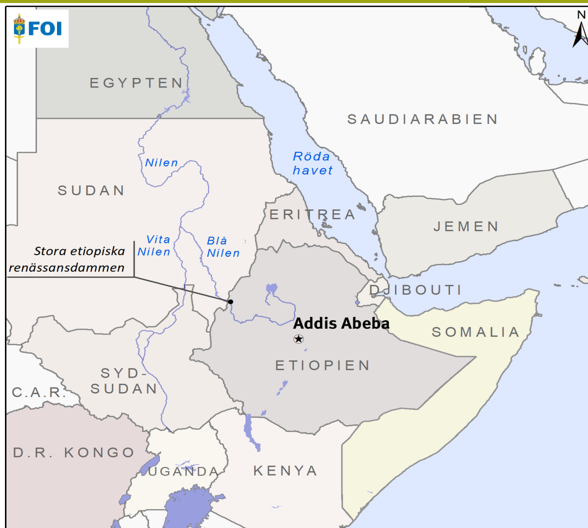
Figur 2: Etiopien med grannländer. Karta: Per Wikström, FOI.

Det uppskjutna parlamentsvalet, som bidrog till att starta kriget, hölls slutligen i början av juni 2021. Abiy Ahmeds parti Prosperity party vann en jordskredsseger. 57 Men det faktum att TPLF och de två huvudsakliga oromoiska oppositionspartierna bojkottade valet innebär att utgången inte uppfattas som legitim av alla. Starka etnonationalistiska strömningar bland oromoerna bidrog visserligen till att sätta Abiy på premiärministerposten, men hans vision är ett modernt och ekonomiskt framgångsrikt Etiopien där befolkningen samlas kring något annat än etnisk identitet. Det har gjort en del av hans etnonationalistiska anhängare besvikna. 58 Den besvikelsen bidrog till regeringskritiska demonstrationer och våldsamheter i delstaten Oromiya under 2020. Flera oromoiska partihögkvarter stängdes och oromoiska oppositionspolitiker